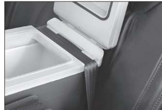
Back seat (Just fasten the cooler to the back seat with the seat belt)