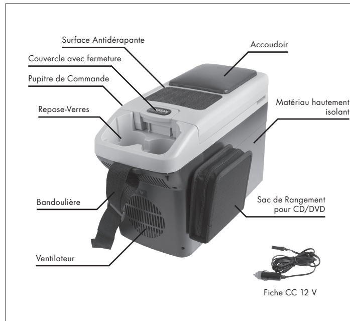
DIAGRAMME DE PRODUIT