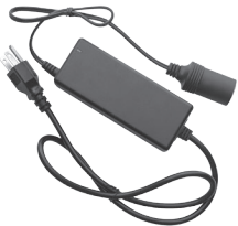
Wagan 5 Amp AC adapter for hotel/ home/office