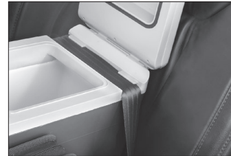
Siège arrière (Fixez simplement le bac réfrigérant sur le siège arrière à l'aide de la ceinture de sécurité)