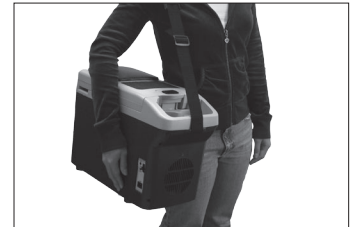
On the shoulder