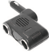
Protection Wagan pour batterie